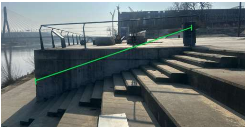
Rys. 2 Rozpiętość pochwytu balustrady.