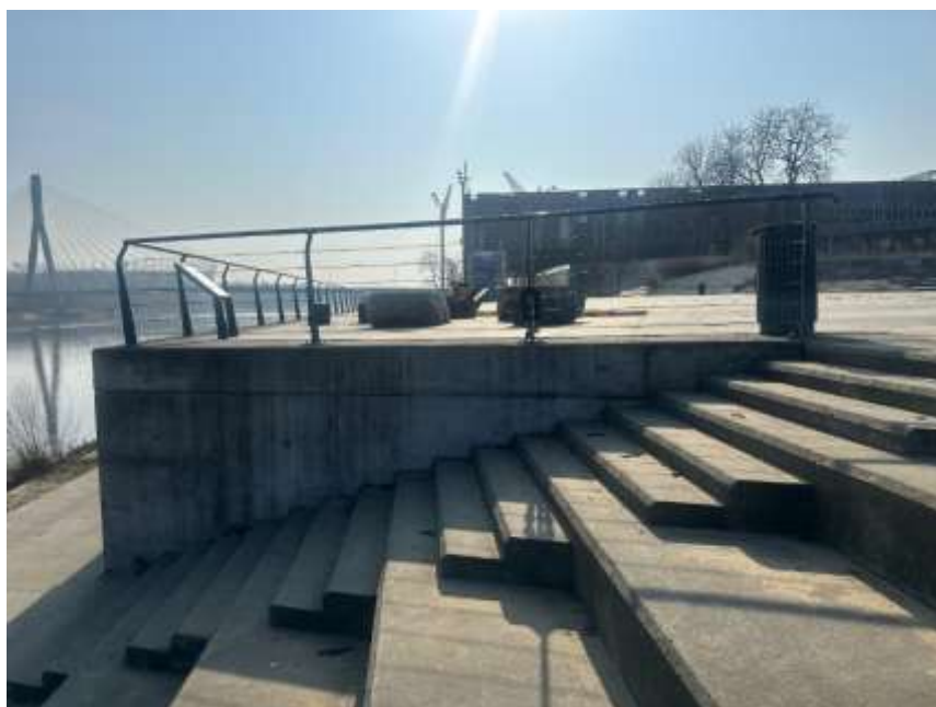
Fot. 1 Schody od strony północnej