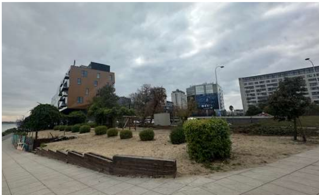
Fot. 3 Obszar inwestycji od strony północno-wschodniej. Zieleń niska przeznaczona do usunięcia lub przesadzenia w inne miejsce.

Zarząd Zieleni m.st. Warszawy ul. Hoża 13a, 00-528 Warszawa tel. 22 277 42 00, mail: kontakt@zzw.waw.pl www.zzw.waw.pl