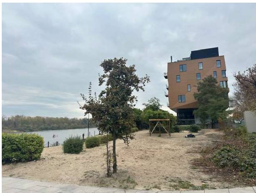
Fot. 6 Obszar inwestycji od strony północnej. Zieleń niska przeznaczona do usunięcia lub przesadzenia w inne miejsce.