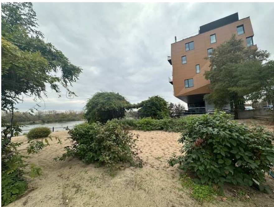
Fot. 7 Obszar inwestycji – istniejąca roślinność. Zieleni niska przeznaczona do usunięcia lub przesadzenia. (autor: Anna Bałazy, ZZW)

Zarząd Zieleni m.st. Warszawy ul. Hoża 13a, 00-528 Warszawa tel. 22 277 42 00, mail: kontakt@zzw.waw.pl www.zzw.waw.pl