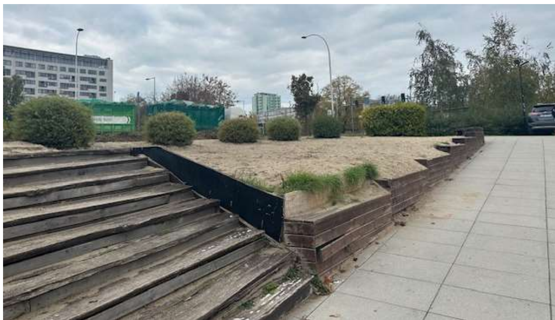
Fot. 4 Obszar inwestycji od strony wschodniej. Zieleń niska przeznaczona do usunięcia lub przesadzenia.