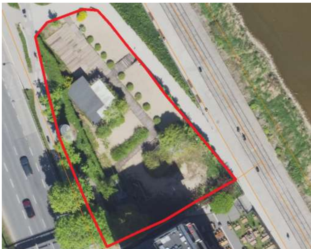
Rysunek 1 Lokalizacja terenu

Teren działki do 2025 r. był zagospodarowany przez tymczasową zabudowę - kontenery i podesty i dotychczas był dzierżawiony przez różne podmioty pod lokale o funkcji gastronomicznej. Obecnie, część naniesień została już zlikwidowana, a dzierżawa zakończona. Na terenie pozostały dwie pergole z wistariami, nasadzenia drzew i krzewów, winobluszcz. Cały obszar działki jest skarpą pokrytą piaskiem rzeczny, którą od strony północno-wschodniej stabilizują prefabrykowany betonowy mur oporowy, schody oraz drewniana konstrukcja oporowa. Na terenie planowana jest także modernizacja drewnianego muru oporowego wraz ze schodami, obecnie trwa wykonywanie dokumentacji projektowej na te prace.