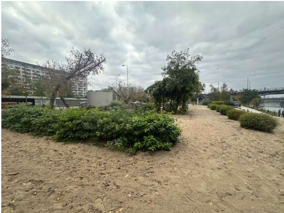
Fot. 8 Obszar inwestycji – istniejąca roślinność. Zieleni niska przeznaczona do usunięcia lub przesadzenia. (autor: Anna Bałazy, ZZW)