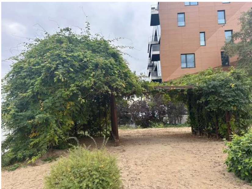
Fot. 1 Obszar inwestycji – Istniejąca pergola nr 1 wraz z porastającą ją wisterią