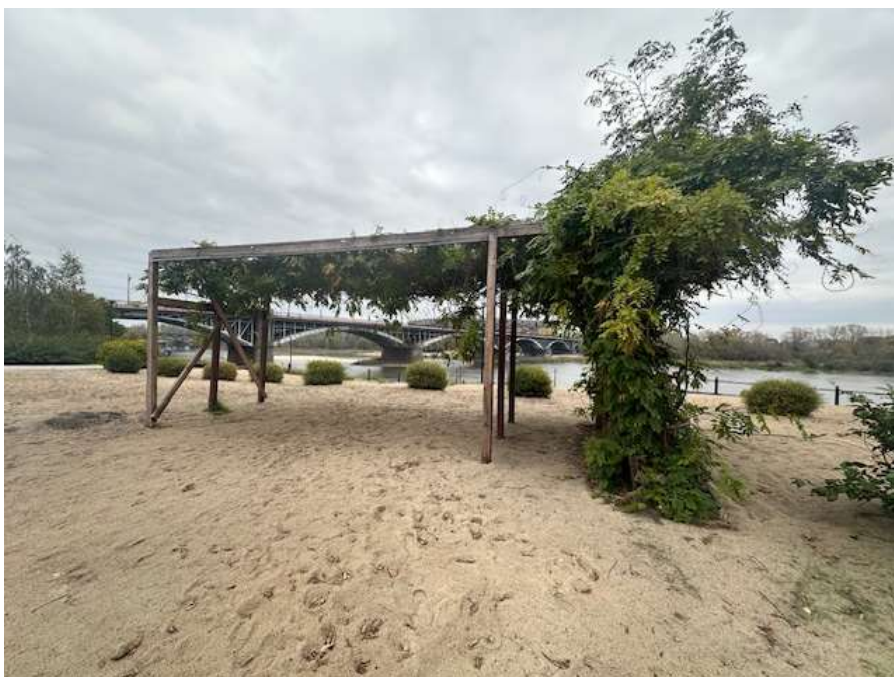
Fot. 2 Obszar inwestycji – Istniejąca pergola nr 2 wraz z porastającą ją wisterią.