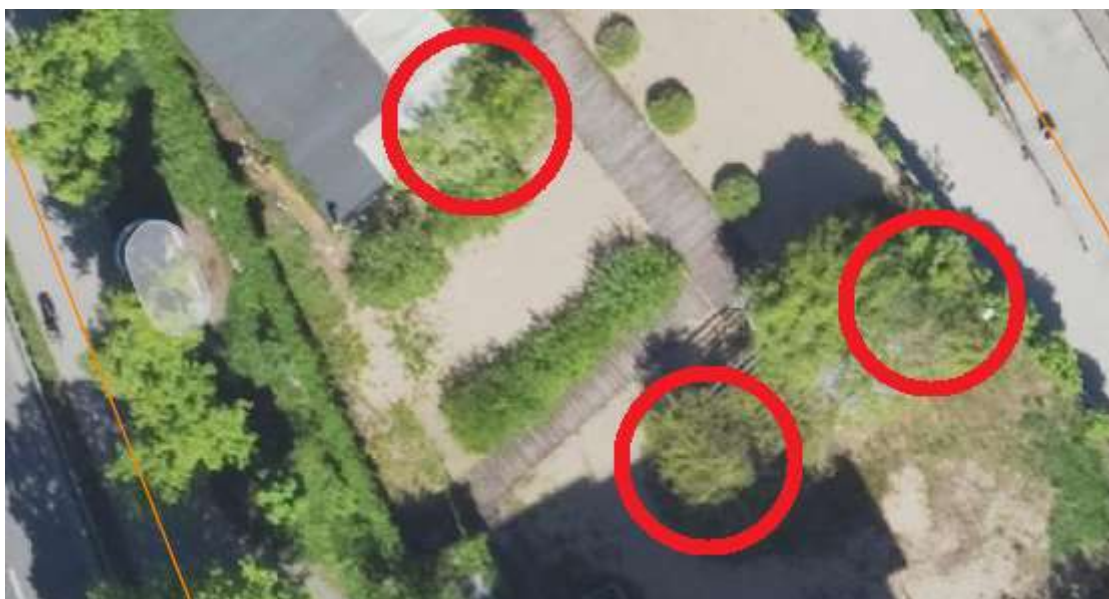
Rysunek 2 Czerwone oznaczenie - przybliżona lokalizacja rosnących pnączy.