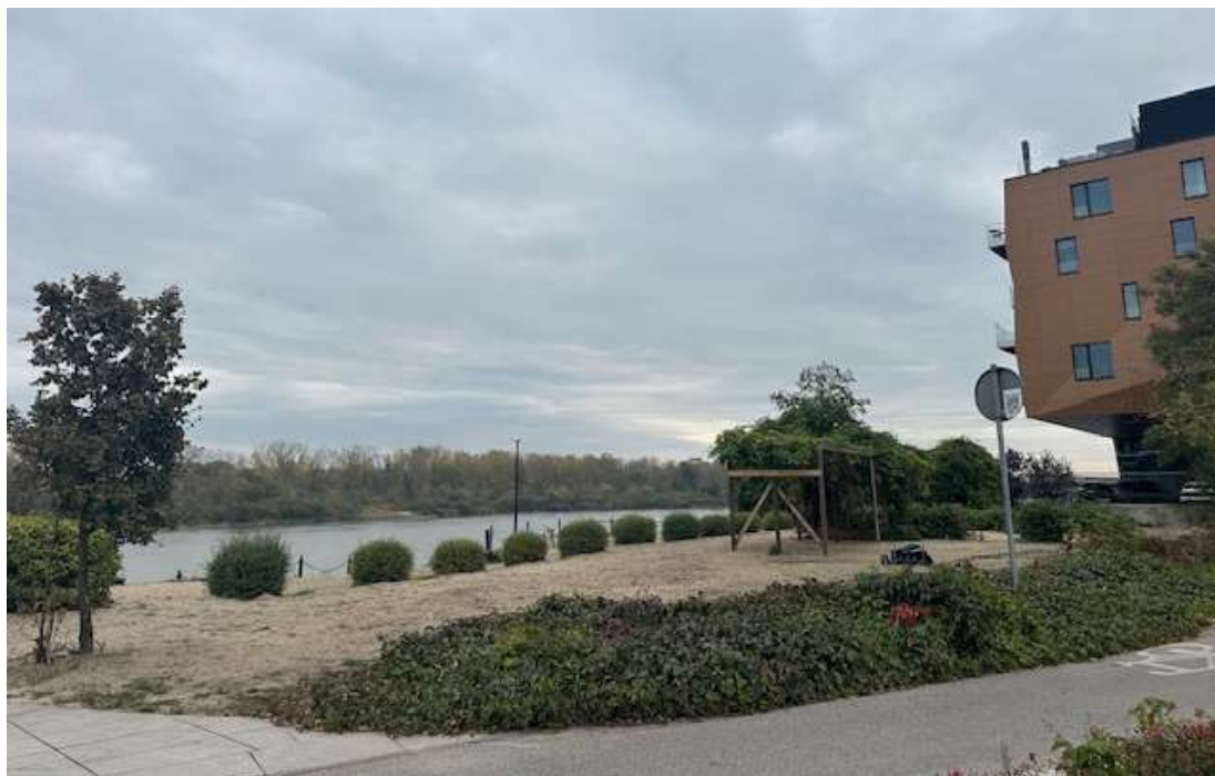
Fot. 5 Obszar inwestycji od strony zachodniej. Zieleń niska przeznaczona do usunięcia lub przesadzenia w inne miejsce.

Zarząd Zieleni m.st. Warszawy ul. Hoża 13a, 00-528 Warszawa tel. 22 277 42 00, mail: kontakt@zzw.waw.pl www.zzw.waw.pl