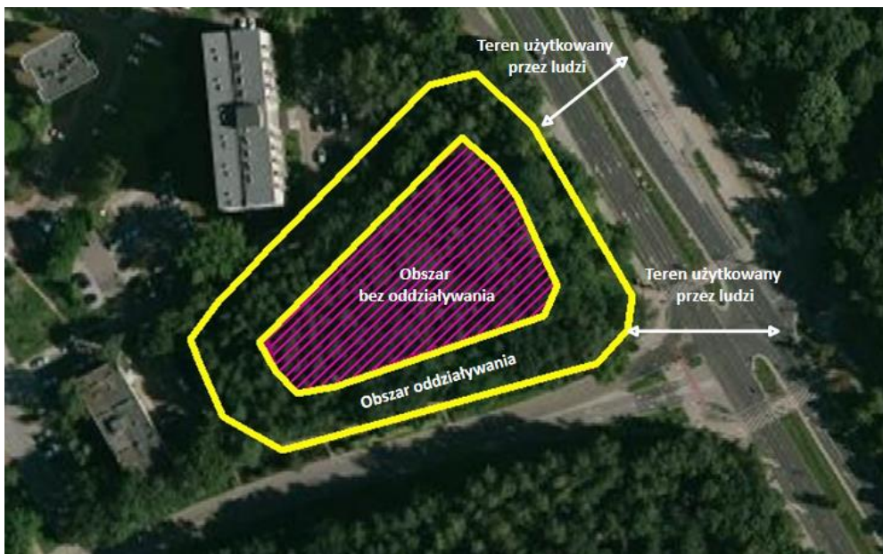
Rysunek 1. Zasięg obszaru oddziaływania i obszaru bez oddziaływania