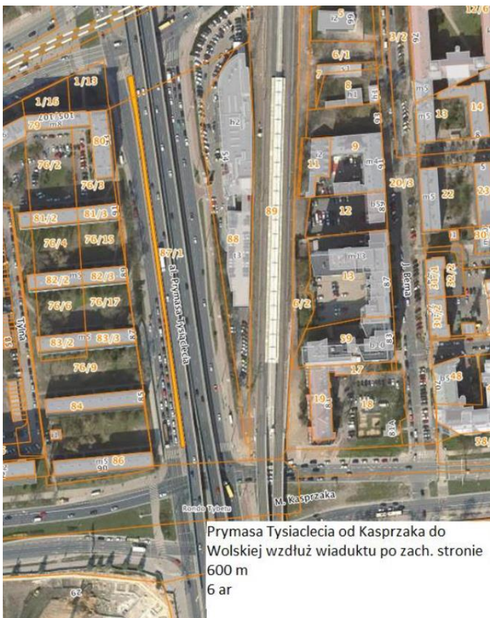
Prymasa Tysiąclecia od Kasprzaka do Wolskiej wzdłuż wiaduktu po zach. stronie 600 m 6 ar