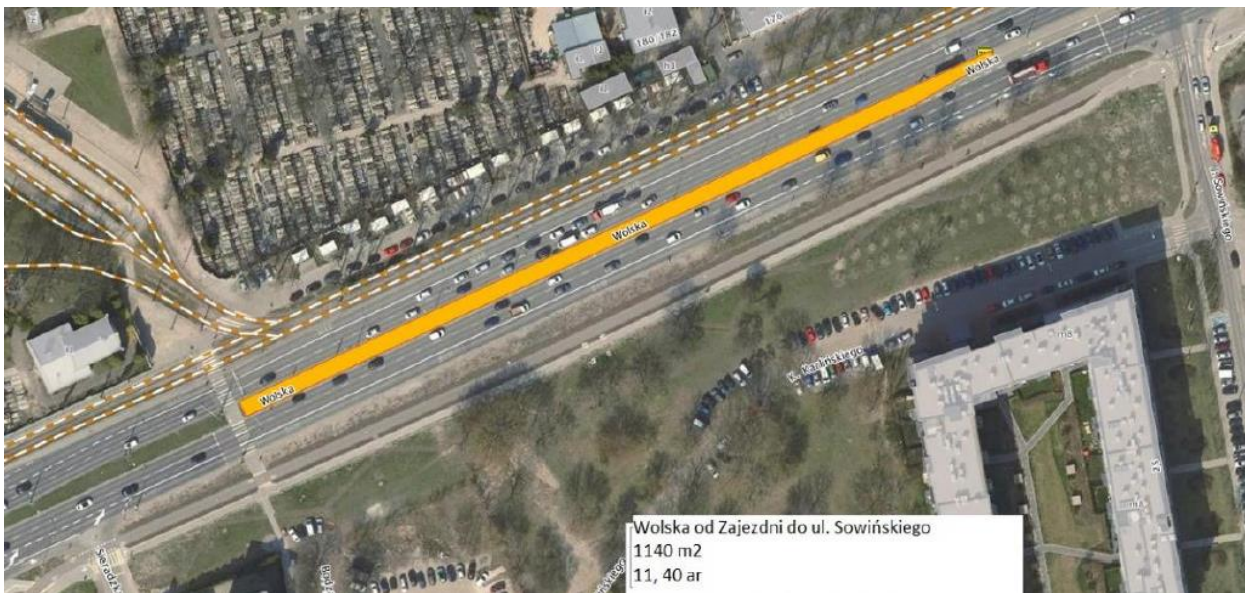
Wolska od Zajezdni do ul. Sowińskiego 1140 m2 11, 40 ar