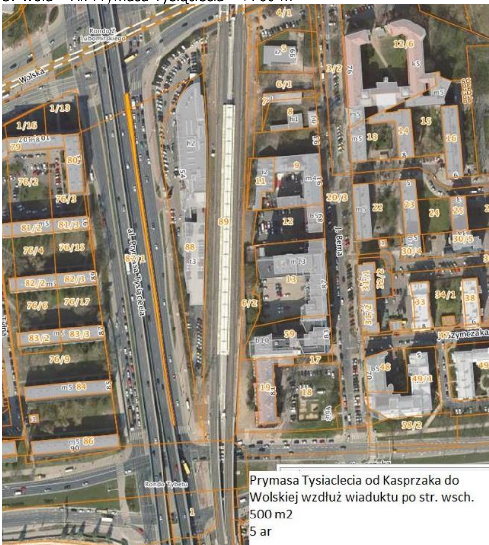
Prymasa Tysiąclecia od Kasprzaka do Wolskiej wzdłuż wiaduktu po str. wsch. 500 m2 5 ar