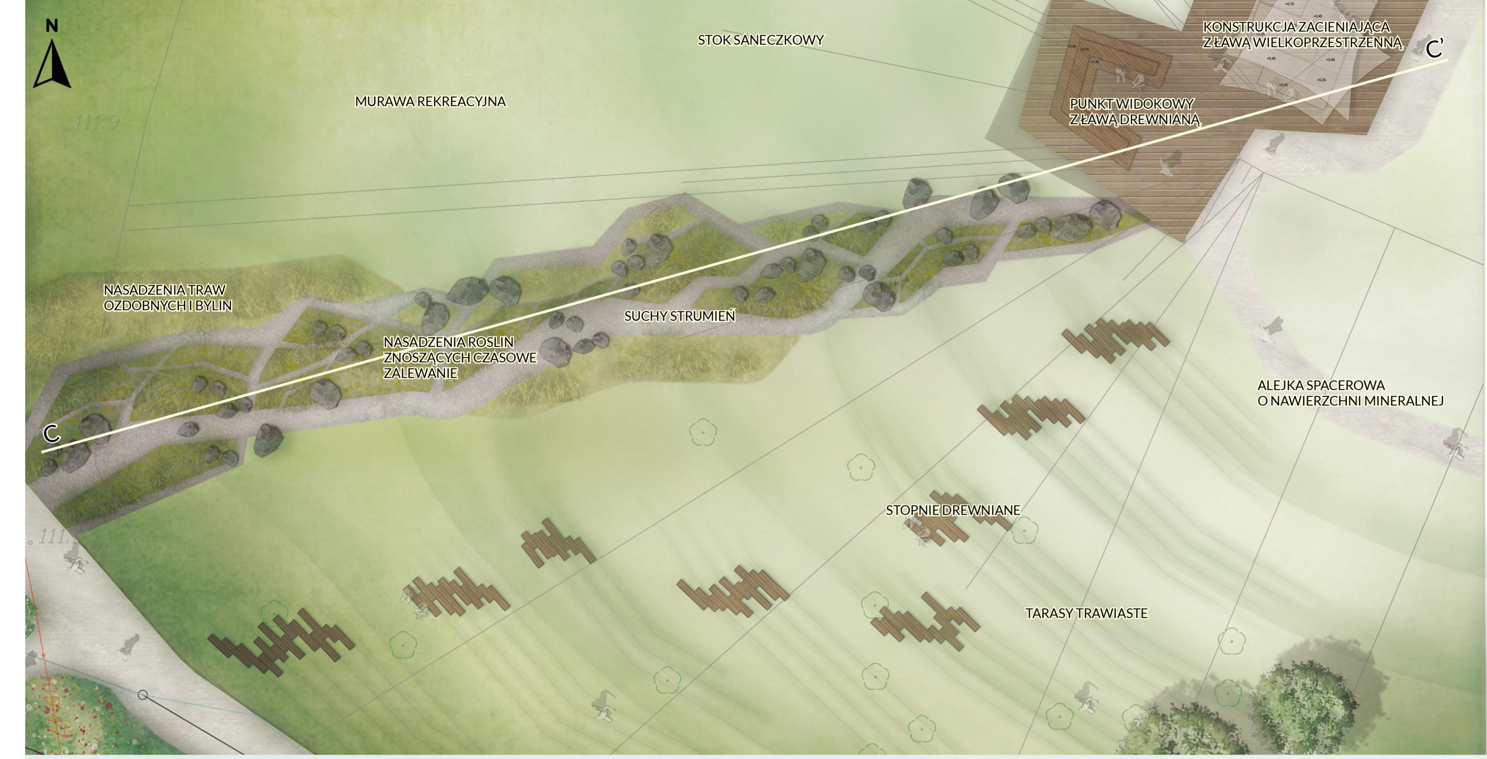
PRZEKRÓJ C-C', SKALA 1:200

RZUT - PUNKT WIDOKOWY I SUCHY STRUMIEN SKALA 1:200