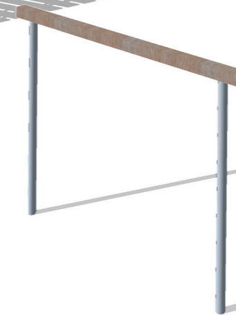
06 stojak na rowery