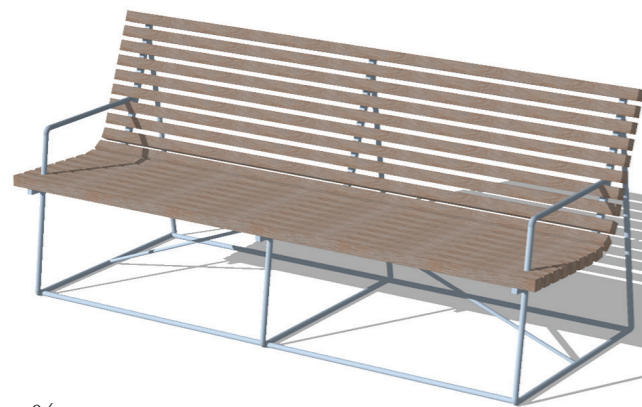
04 siedzisko - typ B (3 osobowe)