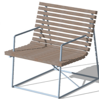
05 siedzisko - typ C (1 osobowe)