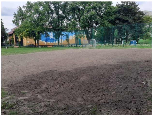
Rys. 1 Teren boiska