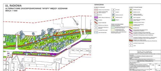
Przykład rysunku koncepcyjnego dla jednej z ulic objętych projektem

Radłowa - zagospodarowanie wyspy między jezdniami