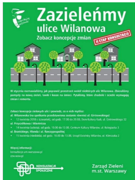
Plakat informujący o II etapie konsultacji

Część tematów dotyczyła etapowania prac, zabezpieczenia i pielęgnacji zieleni istniejącej oraz harmonogramu realizacji projektu. Na każdym spotkaniu obecny był przedstawiciel ZZW, co pozwalało dużo kwestii omawiać na bieżąco. Niezależnie od dyskusji na spotkaniach istniała możliwość przysyłania uwag mailem. Adres mailowy i pocztowy był dostępny na plakatach informujących o wydarzeniu, na stronie ZZW i na stronie konsultacji społecznych.