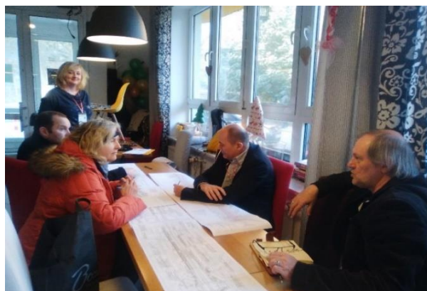
Zdjęcie z jednego ze spotkań konsultacyjnych