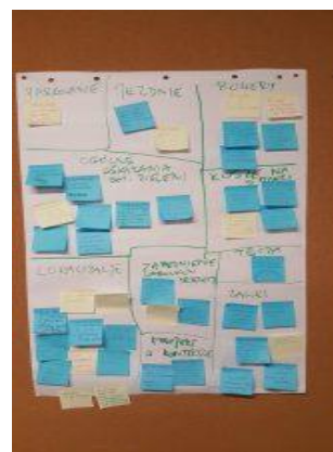
Zdjęcia z przebiegu spotkań warsztatowych