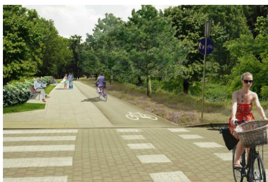
Zagospodarowanie ciągów pieszo-rowerowych

Rekomendujemy (w rejonie wyspy): •Likwidację jezdni północnej i zastąpienie jej zielenią. Wyspa, dzisiaj dzieląca dwa pasy ruchu, tworzyłaby jeden zielony teren. Ruch w obu kierunkach odbywałby się po południowej jezdni.