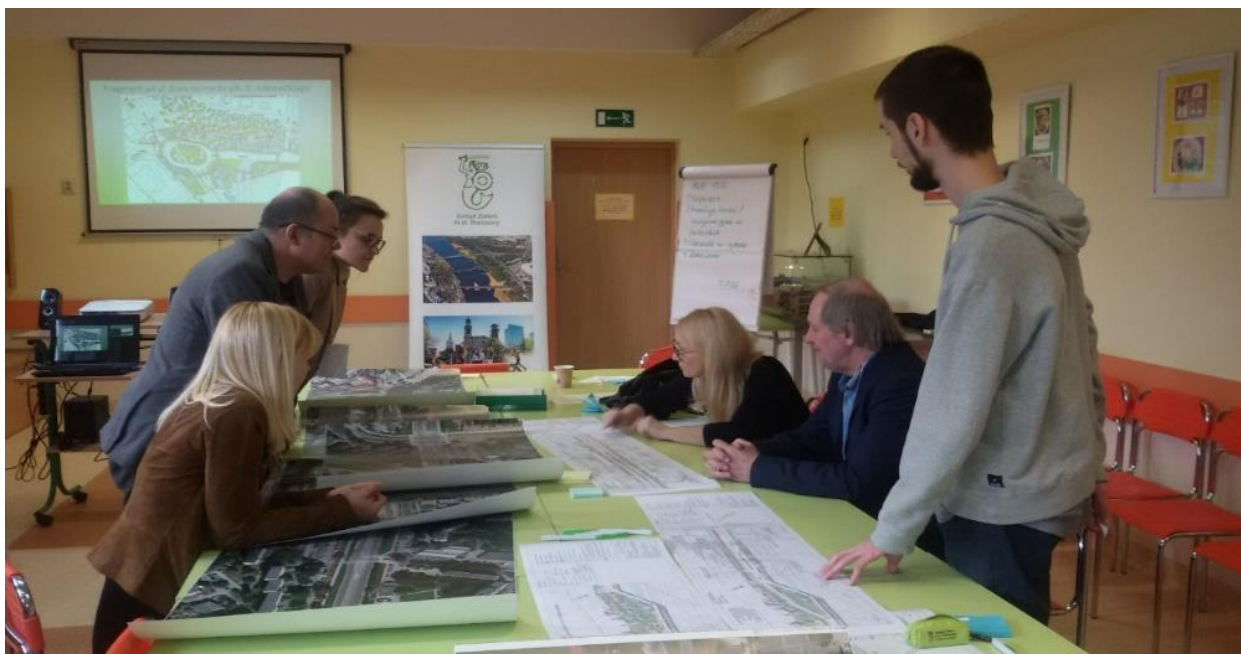
Prezentacja koncepcji w SP nr 82 przy ul. Górczewskiej 201