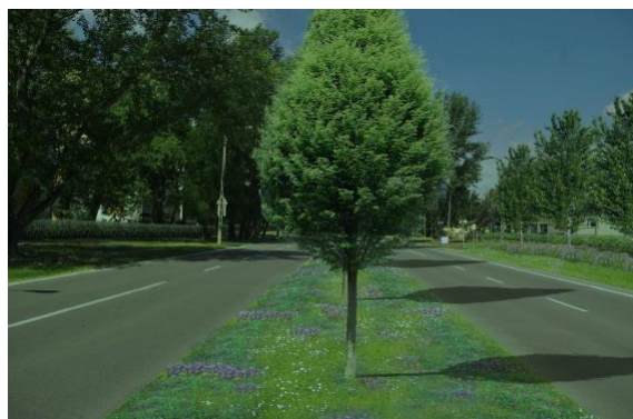
Nasadzenia drzew na miejscu wysepki między jezdniami