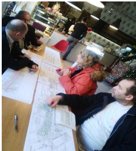
Zbieranie wniosków w Klubokawiarni Sąsiedzi przy ul. Radiowej 24

Szczegółowy opis akcji informacyjnej i przebiegu konsultacji znajduje się w osobnym dokumencie pod linkiem: http://zzw.waw.pl/2018/11/21/raporty-z-konsultacji-spoecznych-zazielenmy-ulice/